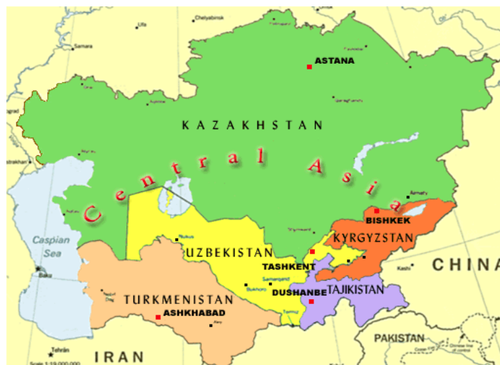
شکل ۱. پراکندگی جغرافیایی کشورهای آسیای میانه

در همکاری اقتصادی استان خراسان رضوی با کشورهای آسیای میانه ارائه می شود. شکل ۱ پراکندگی جغرافیایی کشورهای آسیای میانه را نشان می دهد: